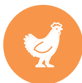
kip / chicken