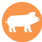
varken / pork