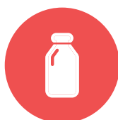
melk / milk