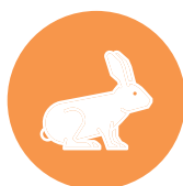
konijn / rabbit