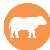
rund / beef