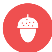
noten / nuts