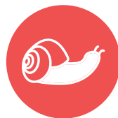
weekdieren / molluscs