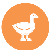
eend / duck