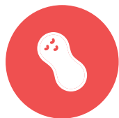
pinda's / peanuts