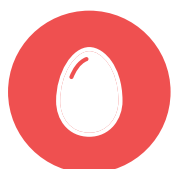
ei / egg