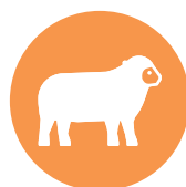
lam / lamb