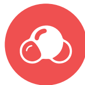
zwaveldioxide / sulfur dioxide

Hebt u vragen over de allergenen in onze gerechten? Aarzel dan niet om het aan onze chef-kok te vragen. Belangrijk: De samenstelling van de producten kan wijzigen.