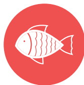
vis / fish