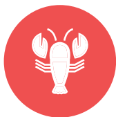
schaaldieren / crustaceans