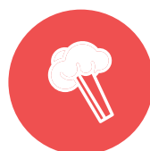
selderij / celery