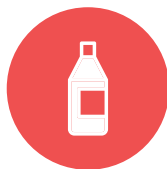
mosterd / mustard