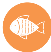
vis / fish