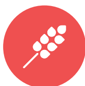
lupine / lupin