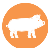
varken / pork