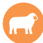
lam / lamb