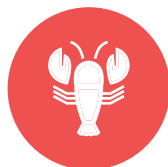
schaaldieren / crustaceans